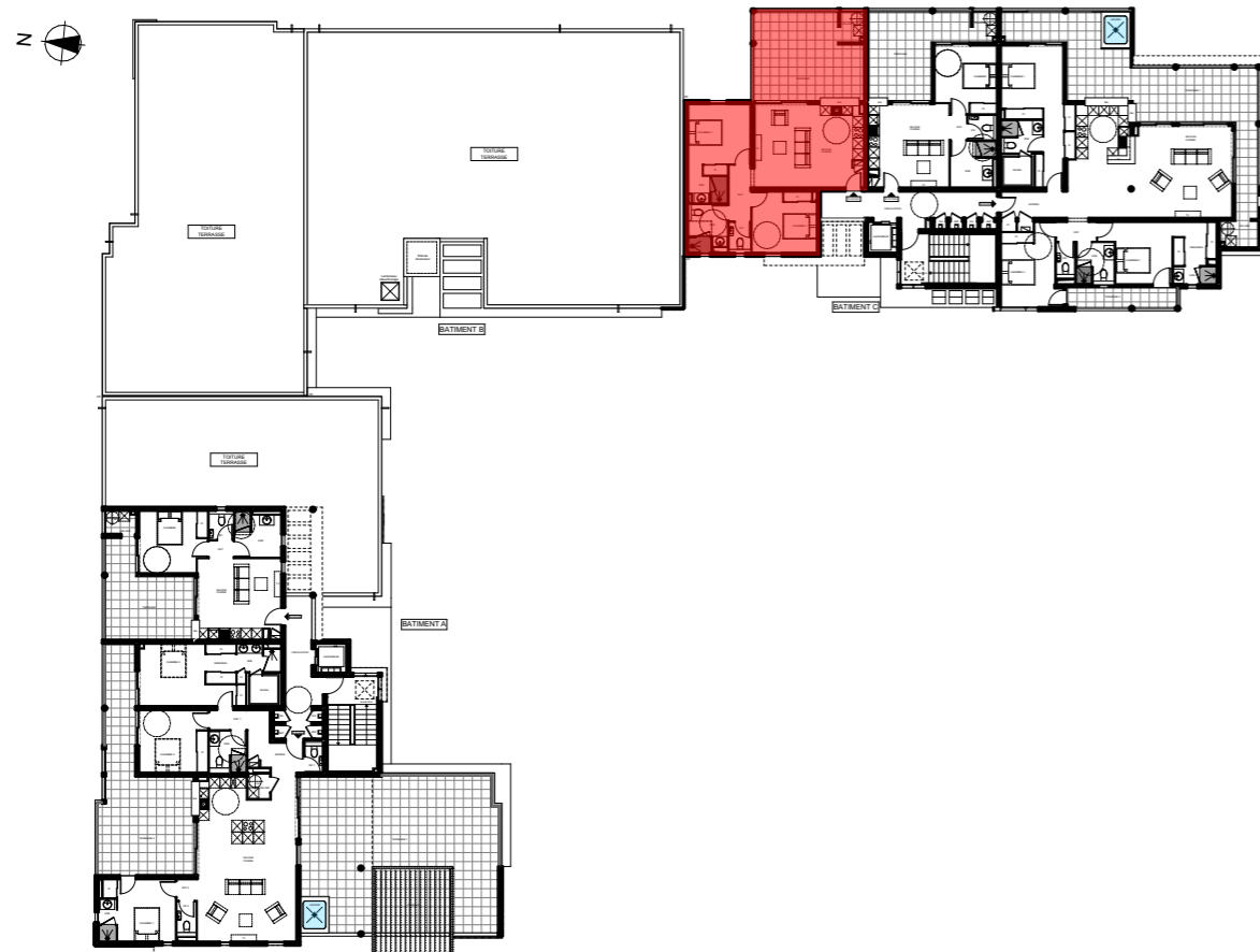
PLAN DE NIVEAU - R+3