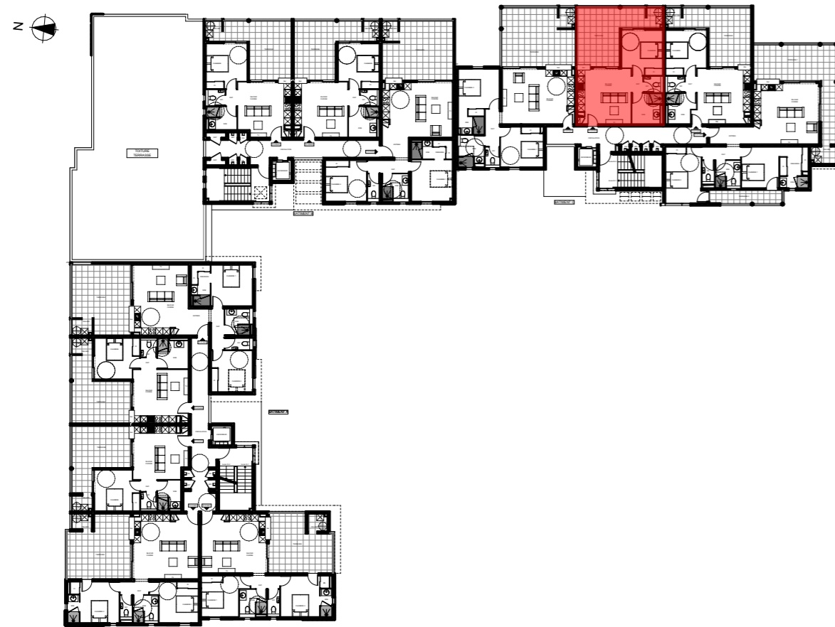
PLAN DE NIVEAU - R+2