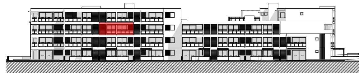
FACADE EST - BATIMENTS B ET C