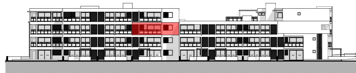
FACADE EST - BATIMENTS B ET C