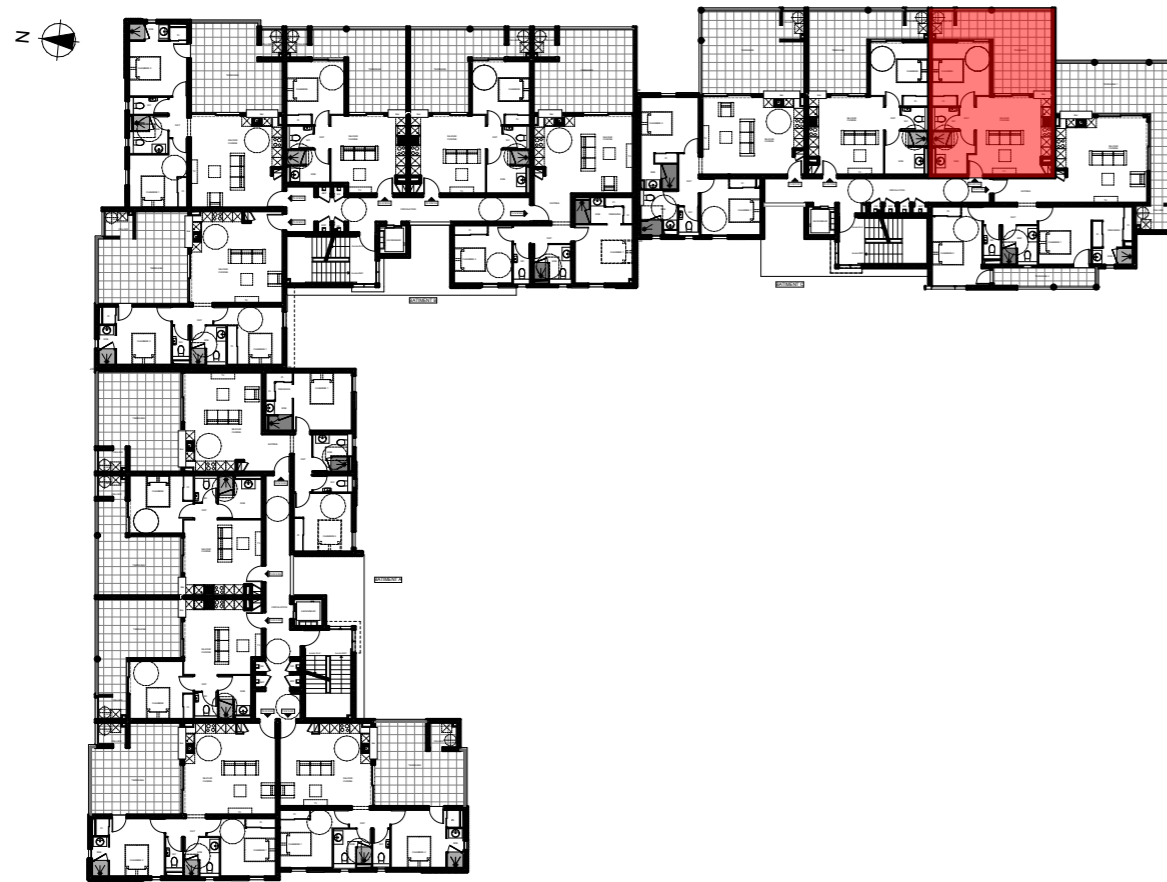
PLAN DE NIVEAU - R+1