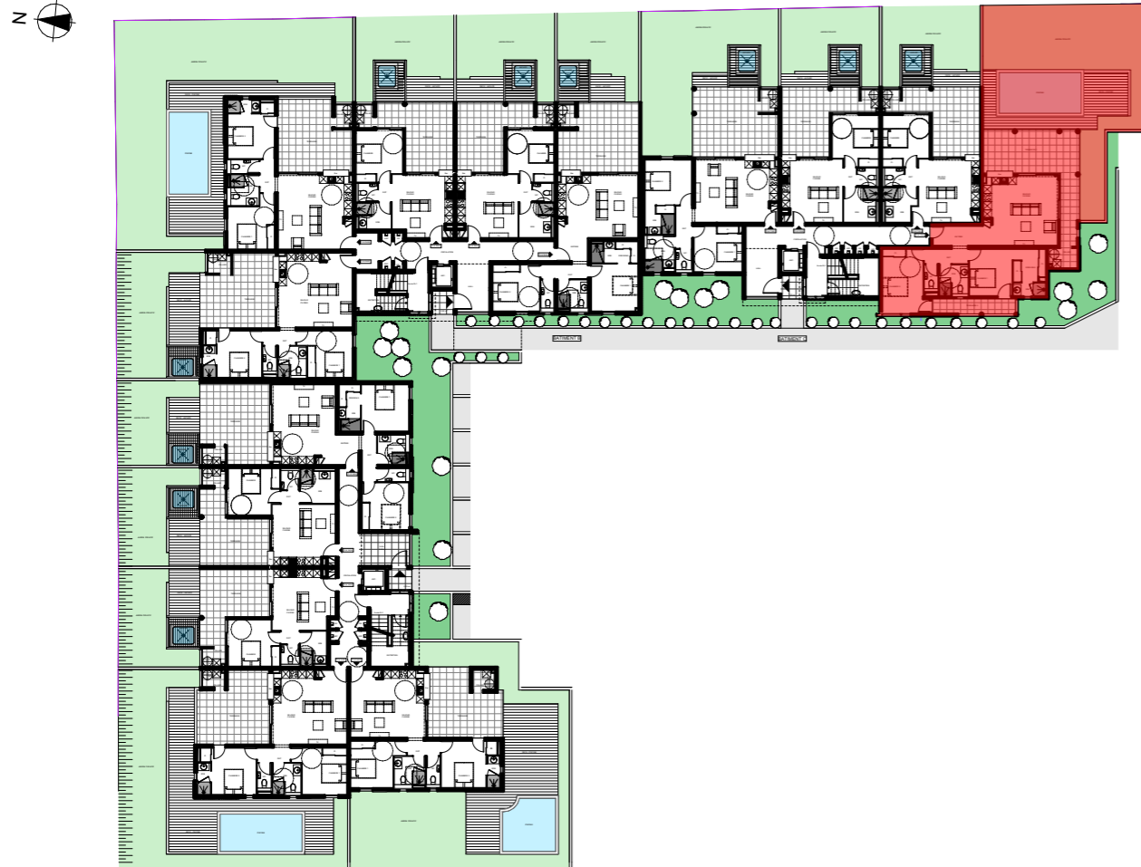
PLAN DE NIVEAU - REZ DE CHAUSSEE