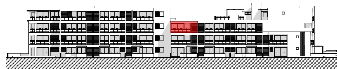
FACADE EST - BATIMENTS B ET C