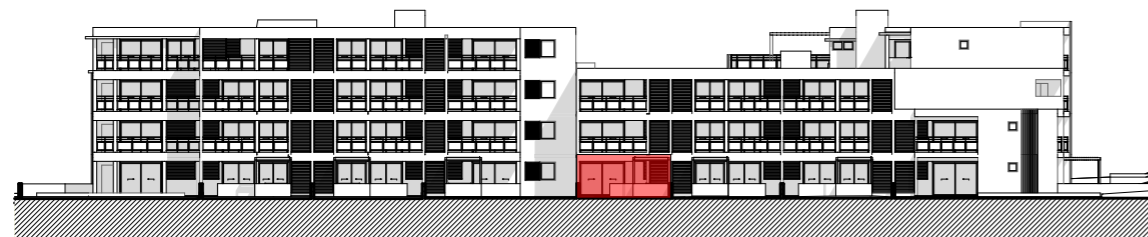
FACADE EST - BATIMENTS B ET C