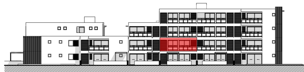
FACADE NORD - BATIMENTS A ET B